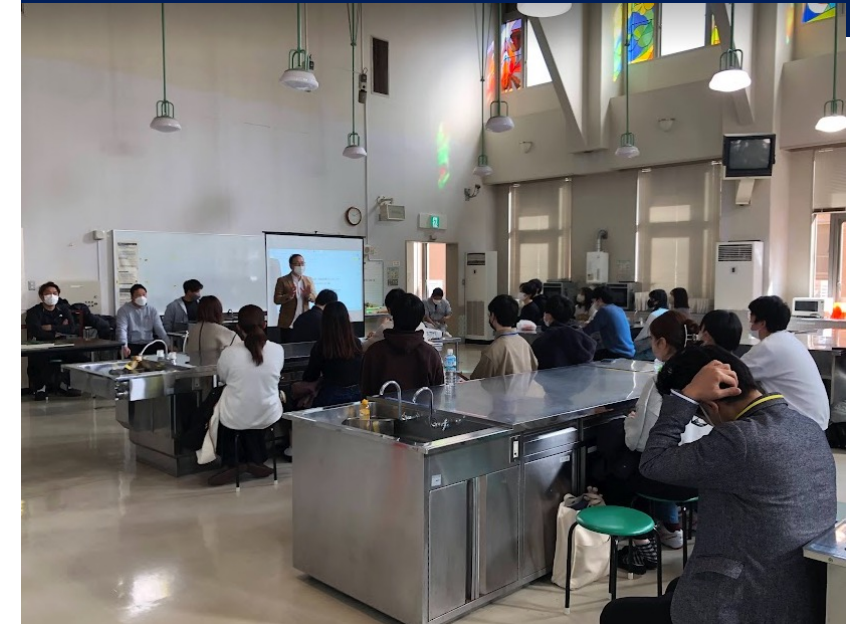
商品開発プロジェクト

体験イベントや規格外農産物の商品開発プロジェクトなど 第一産業の課題解決につながる双方向コミュニケーションを通じ、 段階的に関係が多様化し、深化し、関係が持続する仕組みを構築