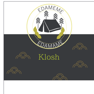
パッケージイメージ