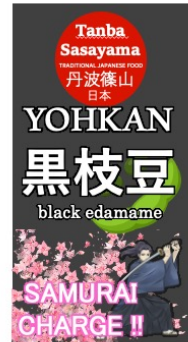
↑商品パッケージ (イメージ)