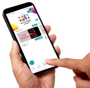
③アプリ上のタイムセールのクーポンをタップすることで、クーポンを使用可能