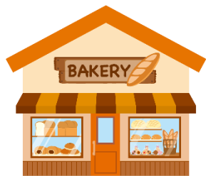
①店舗のタイムセール情報をアプリに登録